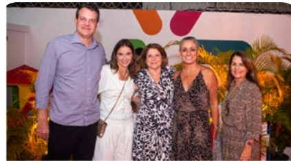
Instituto de Itu apoia plataforma online para estimular troca de conhecimento