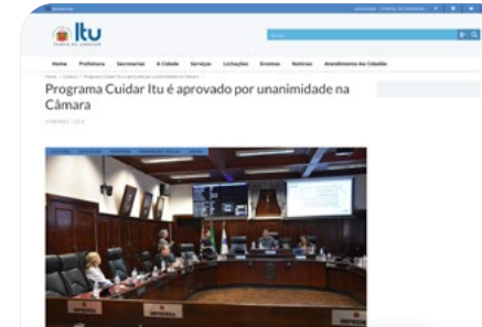
Programa Cuidar Itu é aprovado por unanimidade na Câmara