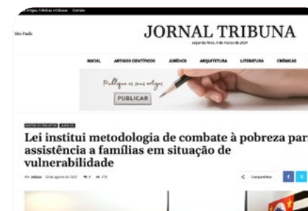
Lei institui metodologia de combate à pobreza para assistência a famílias em situação de vulnerabilidade