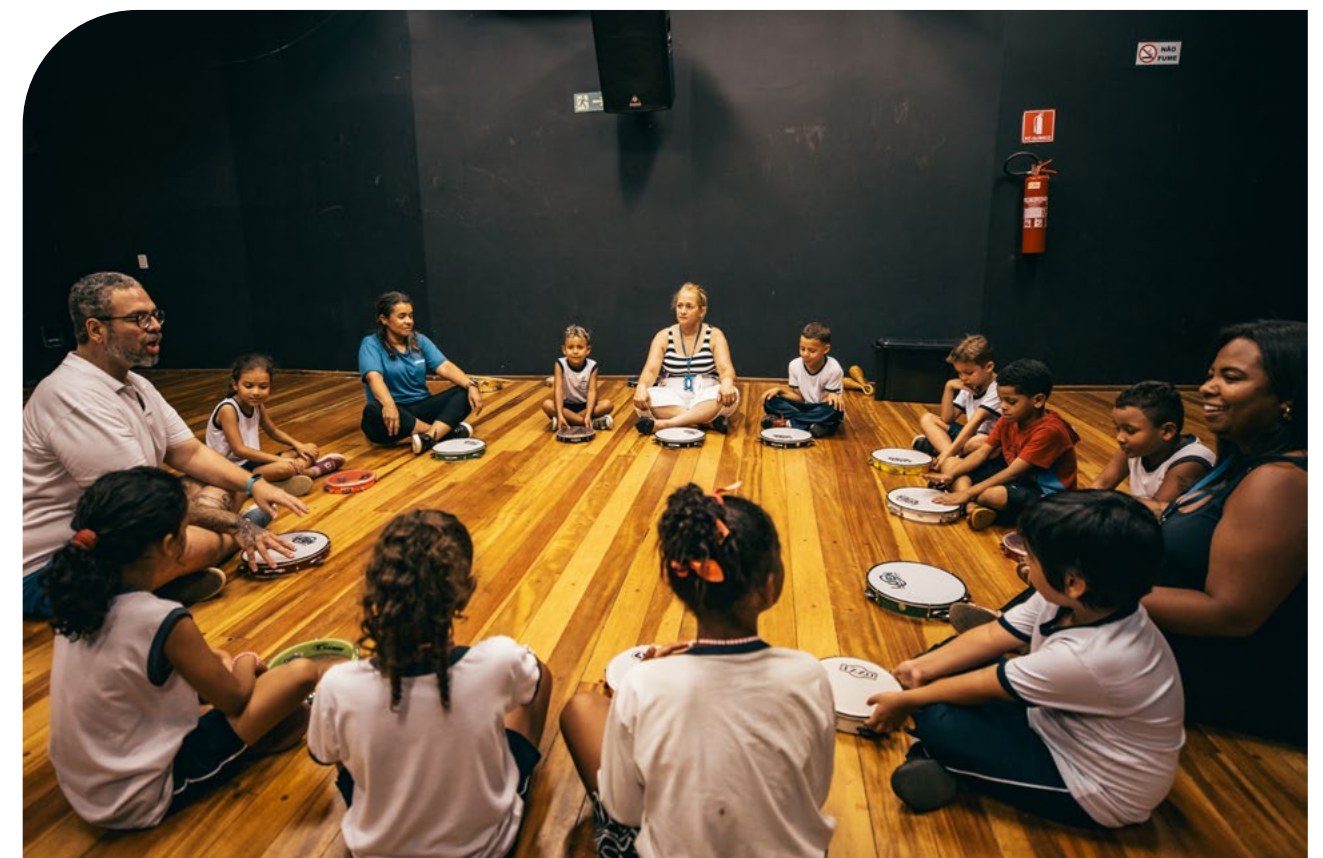
Oficina criativa de música, no Centro de Experimentação em Linguagens (CEL)