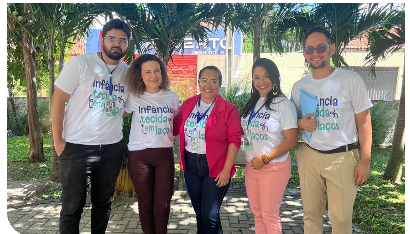
Equipe de atendimento do Programa Infância Tecida em Laços