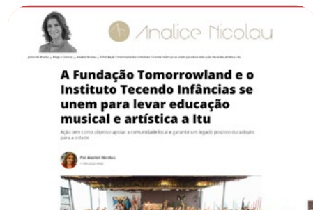
A Fundação Tomorrowland e o Instituto Tecendo Infâncias se unem para levar educação musical e artística a Itu