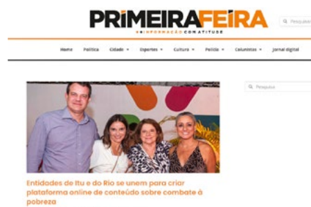
Entidades de Itu e do Rio se unem para criar plataforma online de conteúdo sobre combate à pobreza