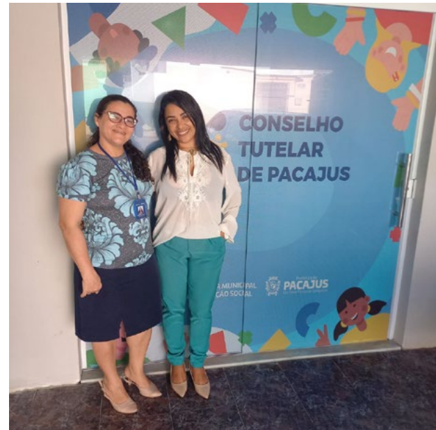
Visitas técnicas aos futuros parceiros

“O projeto Infância Tecida em Laços foi um ganho muito grande para o município de Pacajus, na região metropolitana de Fortaleza. Hoje são 92 famílias acompanhadas por uma equipe técnica qualificada e cuidadosa, que planeja ações intersetoriais relacionadas à primeira infância - saúde, educação e assistência - em parceria com os órgãos públicos, como também, utiliza-se de ativos do CIEDS da região para atuar na situação de vulnerabilidade que as crianças e suas famílias se encontram. Isso é evidenciado pelas parcerias com as Secretarias Municipais, Conselhos e Comitês, bem como, com a proposição de encaminhamentos para as famílias (especialmente as mães) nos próprios projetos do CIEDS executados no Centro Cultural Maloca dos Brilhante (CCMB). A todo momento, a implementação é planejada de uma forma inovadora para que, de fato, o nosso público beneficiado tenha melhoria na qualidade de vida.”