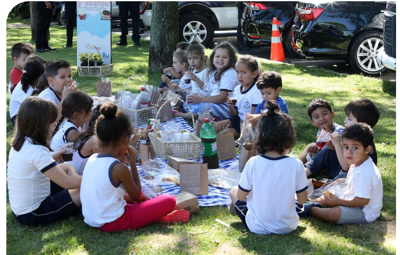
Inauguração do Quarteirão das Crianças em Itu/SP

“ Eu enxergo vida nova na Avenida Ernesto Fávero após a inauguração do Quarteirão das Crianças. É incrível como um espaço proporcionado aos pequenos e aos seus cuidadores transforma o entorno. Em qualquer horário, quando ali passamos, sentimos alegria. Uma intervenção simples que fez toda a diferença. Itu está se tornando uma Cidade para as Crianças! ”