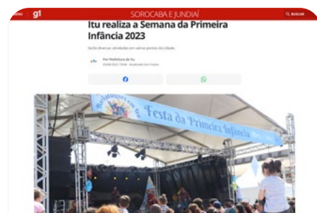
Itu realiza a Semana da Primeira Infância 2023