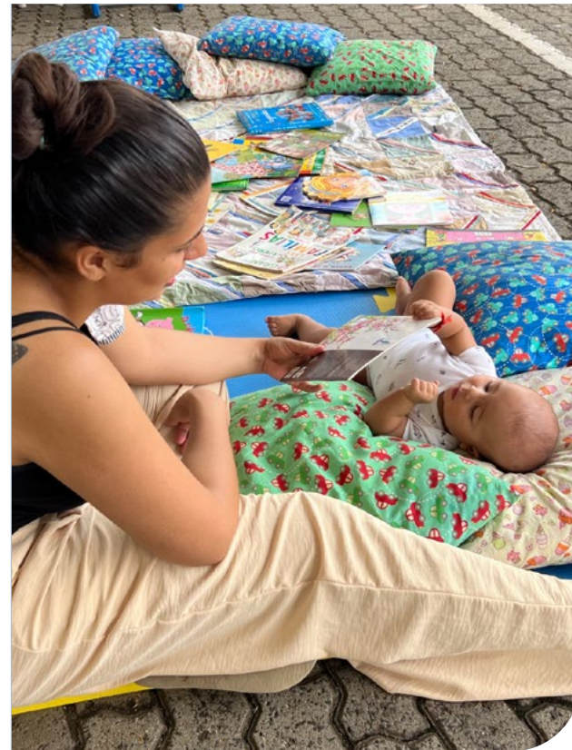
Manhã das Crianças no Pirapitingui

“ Manhã das Crianças na região do Pirapitingui, além de ter sido um evento incrível, foi um divisor de águas tanto para gestão, quanto para população. A importância da infância, com a peça teatral, ampla distribuição gratuita de sorvete, pipoca, algodão doce, frutas, cachorro-quente, suco... atividades físicas, lúdicas, recreativas, informativas, foi devidamente reconhecida, trazendo muita satisfação para quem participou, tanto na organização, quanto frequentadores: crianças e adultos. Um excelente momento que se repetiu na “Manhã de Natal” e, com certeza, ficará marcado no calendário de eventos da região. ”