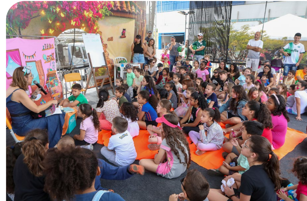
Evento Manhã das Crianças - Semana da Primeira Infância - Itu/SP