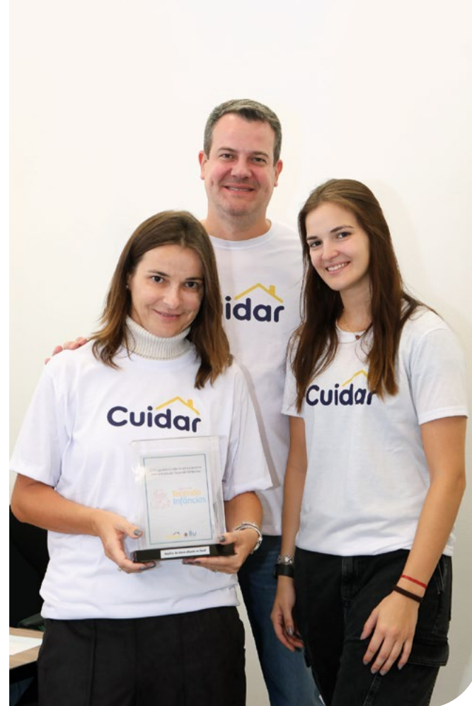
Inauguração do Programa Cuidar

“ O Programa Municipal Cuidar Itu, desenvolvido em conjunto com o Instituto Tecendo Infâncias, está proporcionando oportunidades e qualidade de vida para as famílias com crianças de 0 a 6 anos que, por diversas questões sociais, convivem com a vulnerabilidade. A visão intersectorial que o programa oferece às famílias ituanas vai além do diagnóstico holístico de sua realidade. Ali, cada cidadão recebe orientações sobre os seus direitos e deveres e consegue traçar um plano de vida sob perspectiva humana e com acompanhamento de profissionais capacitados e que conhecem a estrutura pública. Quando o Cuidar transforma a realidade de uma pessoa ele está - aos poucos - transformando toda a sociedade.