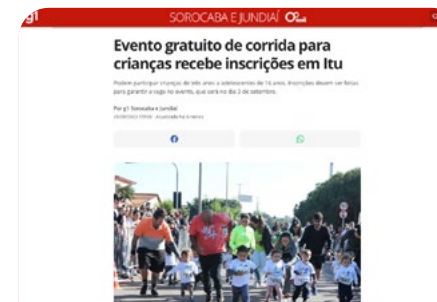
Evento gratuito de corrida para crianças recebe inscrições em Itu