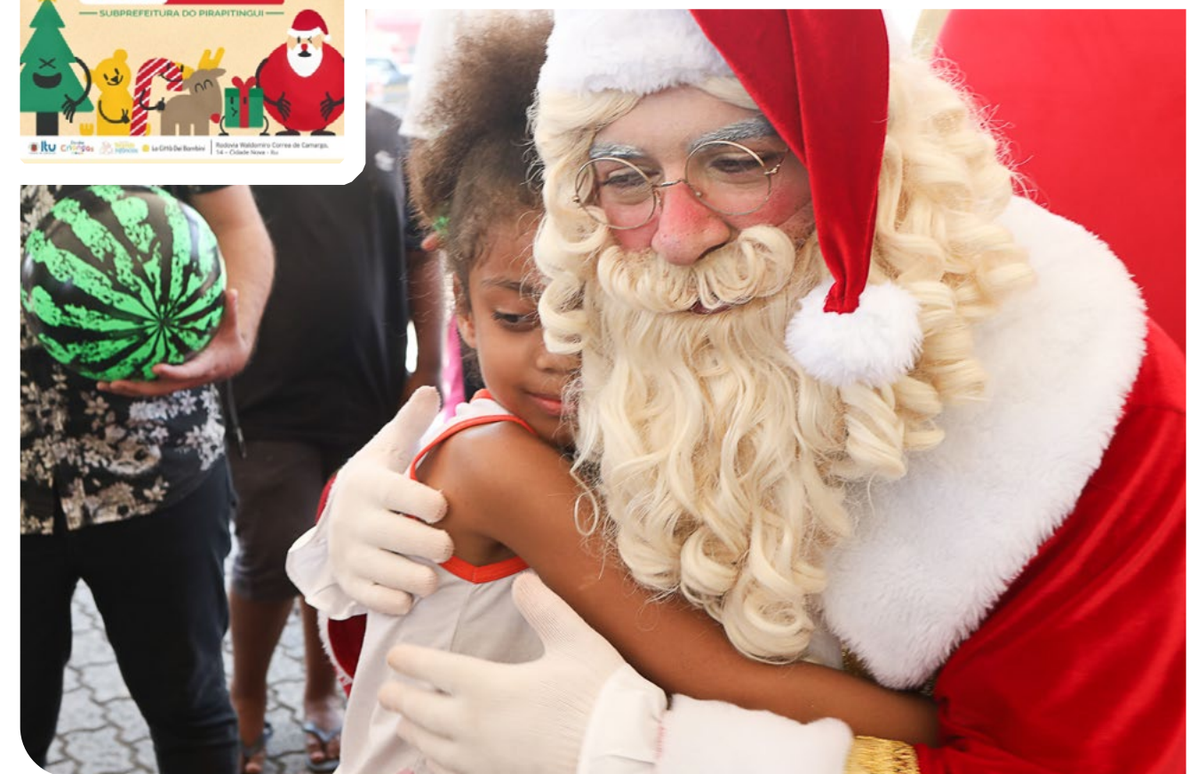
Manhã de Natal com as crianças, em Itu/SP