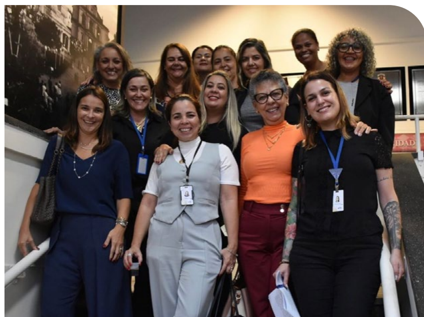
Defesa do Programa Cuidar, na Câmara dos Vereadores

Em agosto de 2023, a equipe de gestores municipais, apoiada pelo Instituto Tecendo Infâncias, formulou uma Proposta de Lei, apresentou e defendeu o Programa Cuidar na Câmara de Vereadores de Itu. O programa foi então aprovado como Lei Municipal nº 77/2023.