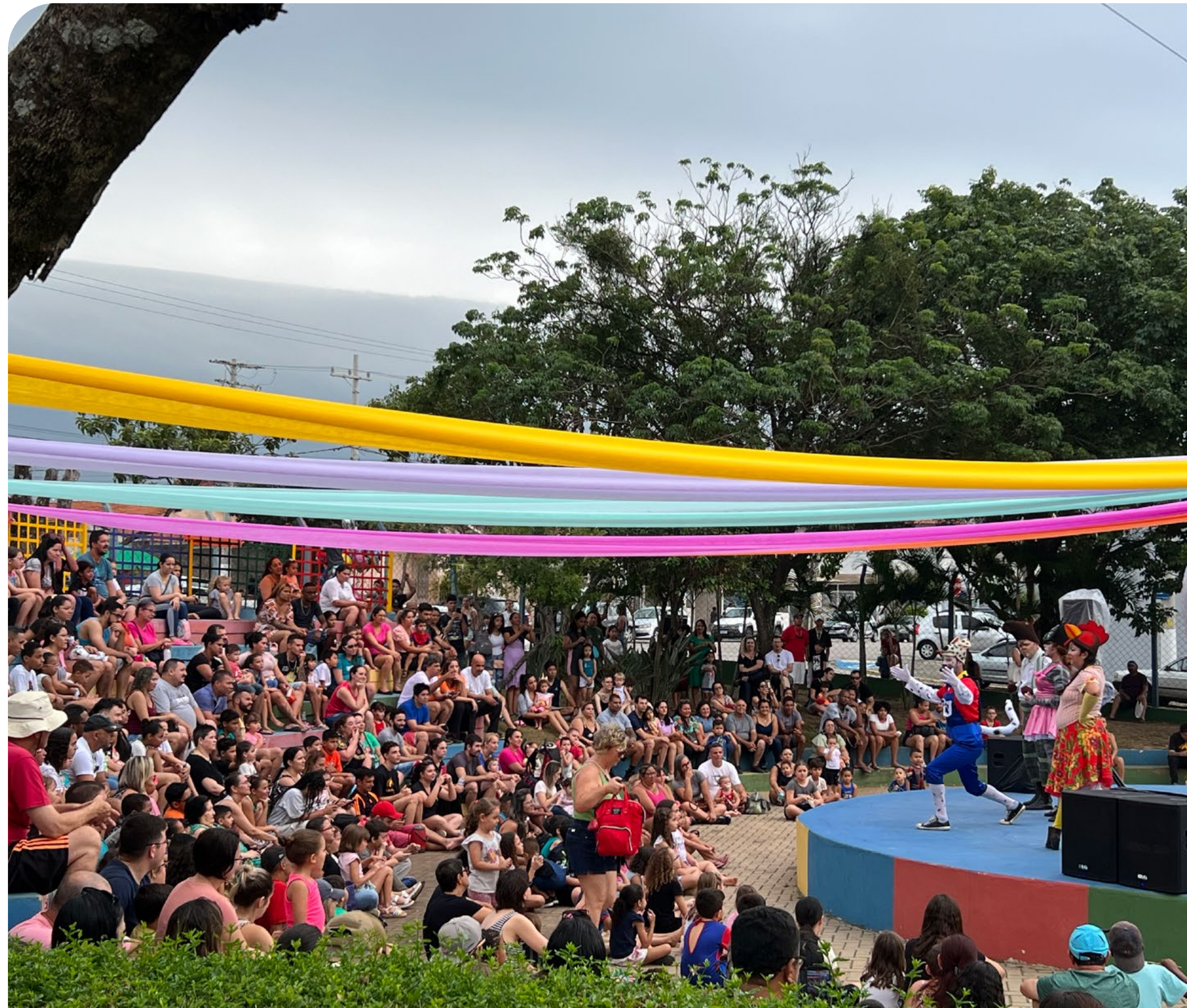
Manhã das Crianças no Pirapitingui

A outra ação aconteceu na Cidade das Crianças, em Itu, no dia 12 de outubro, junto com o aniversário do parque. Novamente muitas atividades e brincadeiras foram oferecidas às crianças e suas famílias, além da apresentação da peça “Os Saltimbancos”, também encenada pela Yara Produções.