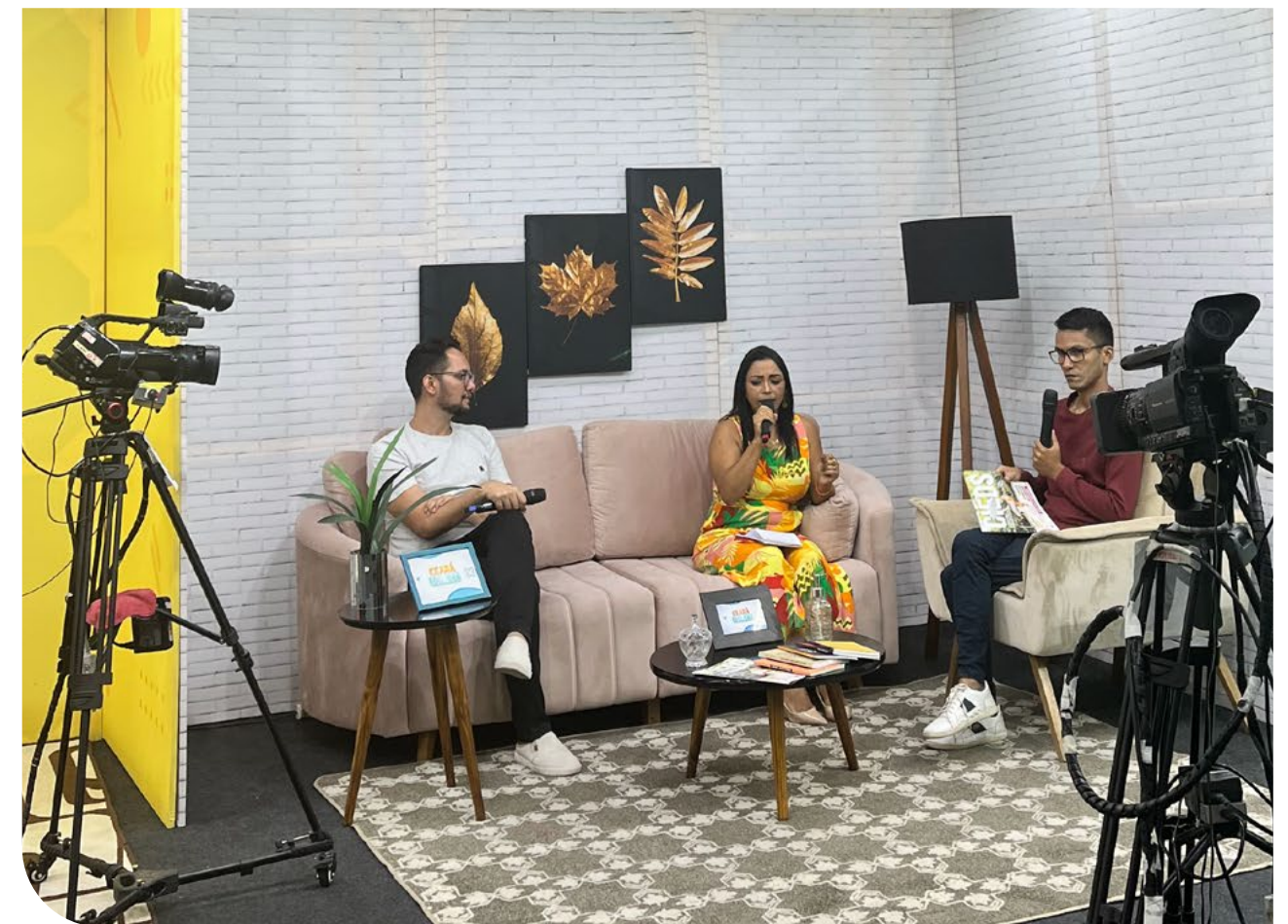
Divulgação na TV local de Pacajus: o Programa Ceará Connect