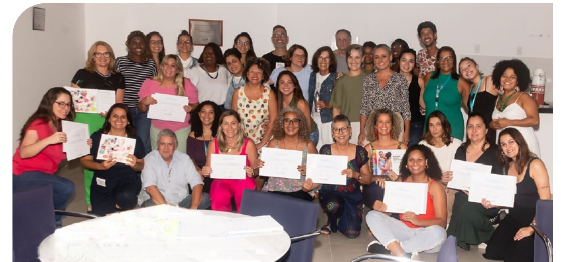
Imersão das equipes das secretarias municipais e do Instituto Tecendo Infâncias no Dara

Em março, as equipes das secretarias municipais passaram por uma capacitação, realizada em workshops virtuais. Depois disso, gestores públicos de Itu foram convidados a participar de uma imersão no atendimento do Instituto Dara, no Rio de Janeiro.