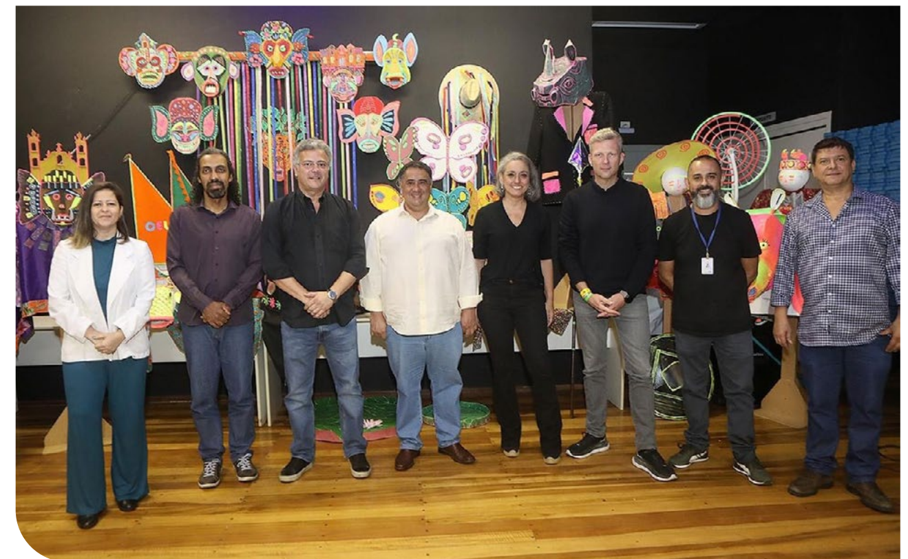
Lançamento da Escola Tomorrowland de Música e Artes